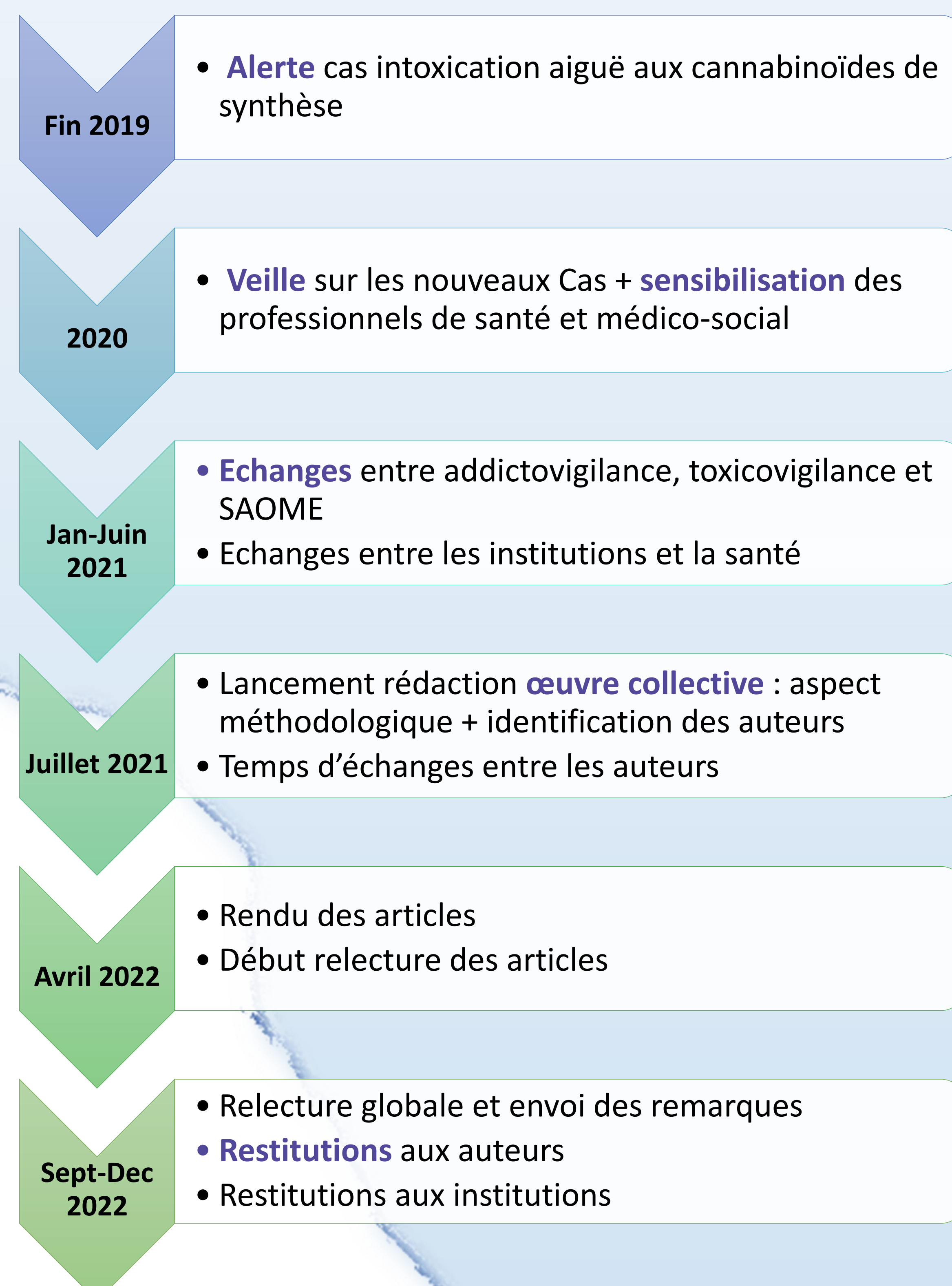
Figure 1 : étapes clés de la production de l'œuvre collective sur les cannabinoïdes de synthèse. Ile de La Réunion. 2022